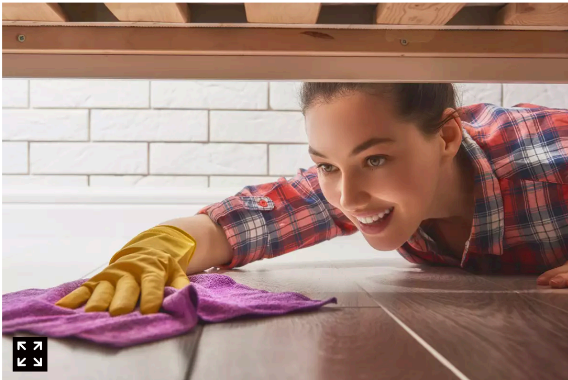
האבק שנאסף יעבור בקפסולות לירח, צילום: ללא קרדיט

כאמור, המשפחות שמשתתפות מקבלות ערכות איסוף פשוטות, ימלאו אותן באבק מבתיהן ומחזירות את הקפסולה האישית למרכז היזמות – שם תתויג, מקבלת ברקוד אישי ונשמרת. חלק מהדגימות ישוגרו בשנת 2026 לירח, כחלק ממשימת שימור בין-לאומית; האחרות יישמרו בתנאי מעבדה בישראל, לצורך מחקר עתידי.