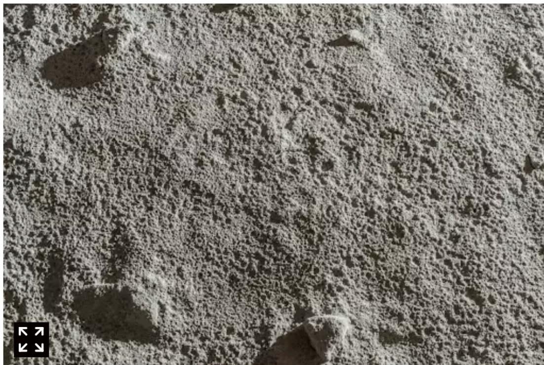
אבק ירח (אילוסטרציה)

מה עשיתם עם האבק של פסח? התלמידים הישראלים ישלחו אותו לחלל. פסח כידוע הוא חג הניקיונות. בניסיון לאתר את החמץ מוצאים גם לא מעט אבק בבתים בישראל. רוב האנשים רוקנו את האבק הישר אל הזבל – אלא שיש תלמידים ישראלים שאוספים אותו ואפילו ישלחו אותו אל החלל. בפרויקט ייחודי מסוגו תלמידים מתיכון רב תחומי עמל שבעמק חרוד יאספו אבק מבתי משפחות בישראל – וישגרו אותו לירח במהלך 2025. המטרה היא – יוזמה חינוכית-קהילתית לתיעוד החיים בישראל, באמצעות קפסולות אבק שישוגרו לחלל.